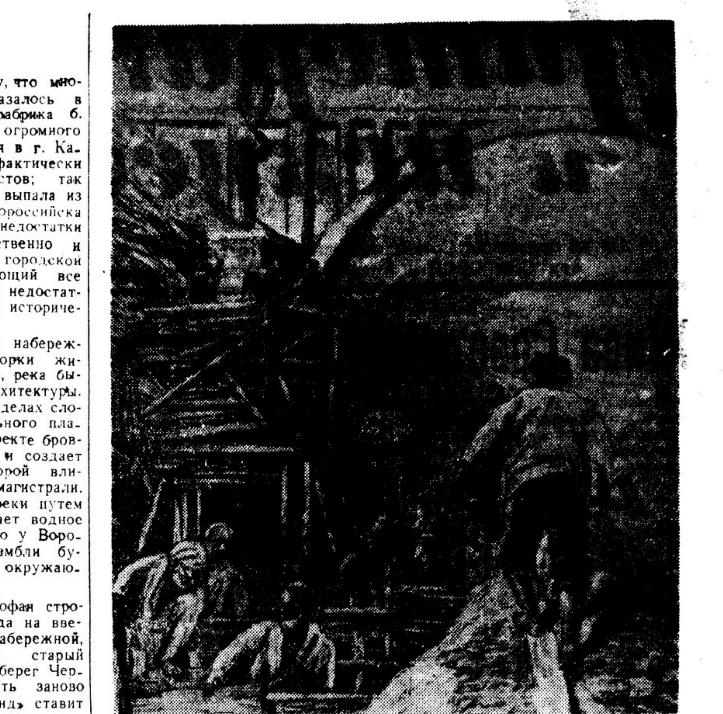
Чирчикстрой. Литография В. КЕДРИНА (Ташкент).

С литературой Коми АССР познакомила нас представительница республиканской организации С. Никишев