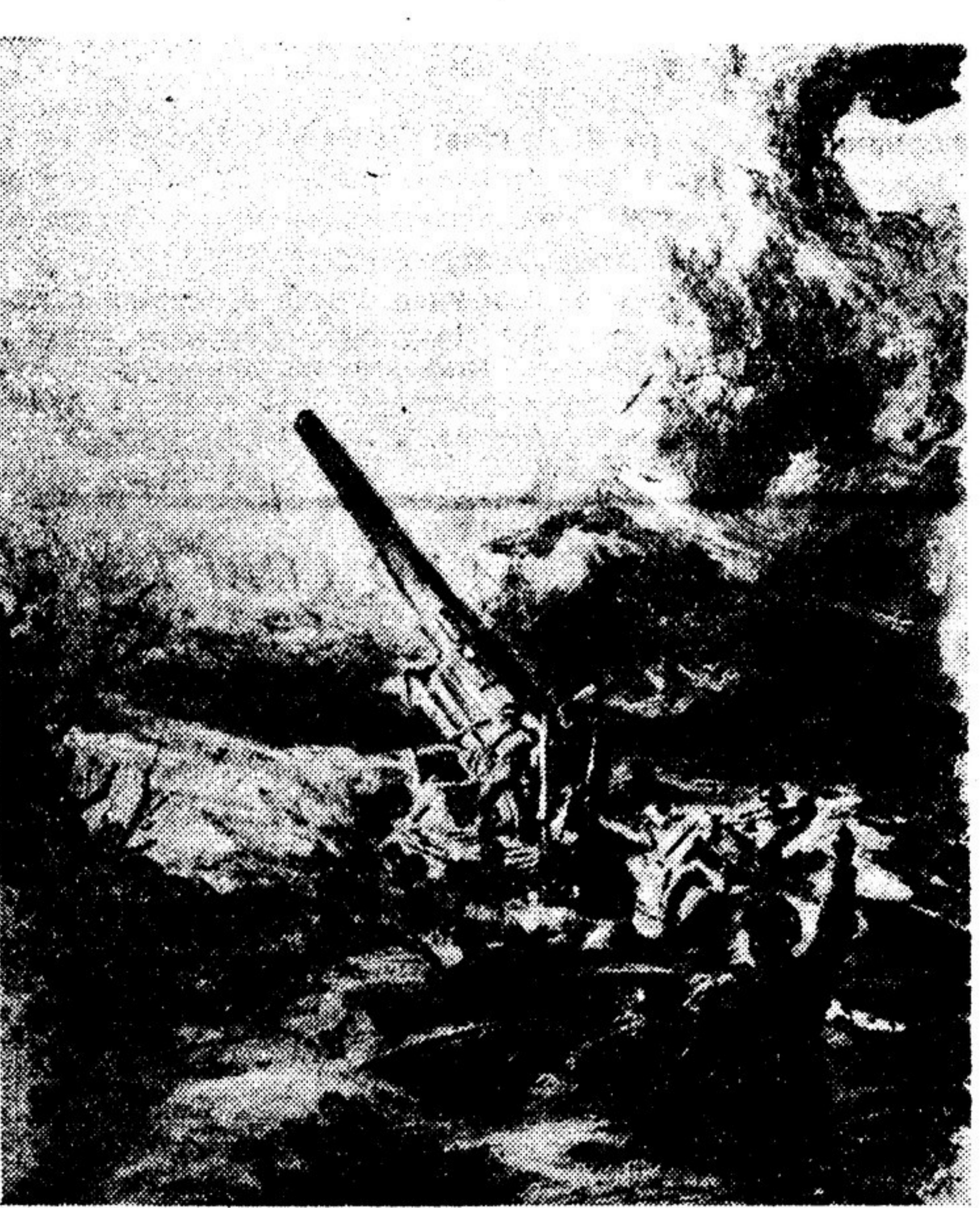
Артиллерийский огонь по немецким укреплениям. Из альбома художника-фронтовика И. ТИТОВА.